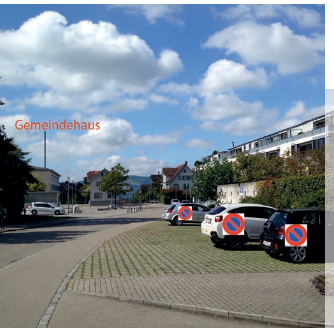
Häufig betroffen vom wilden Parkieren der Kirchgänger: Anwohner der Berghofstrasse