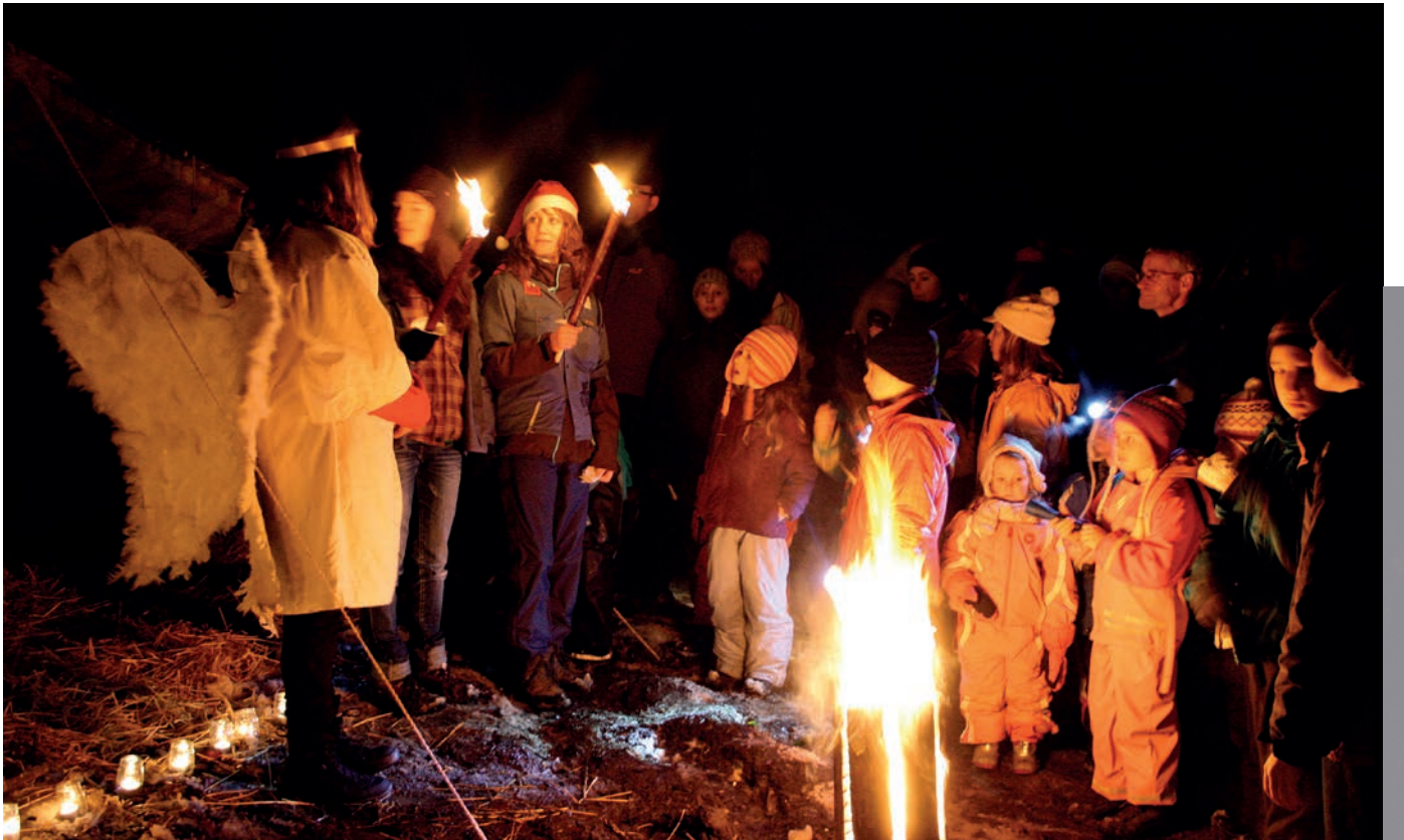
Einladung zur Waldweihnacht des Cevi Gossau am Samstag, 13. Dezember.