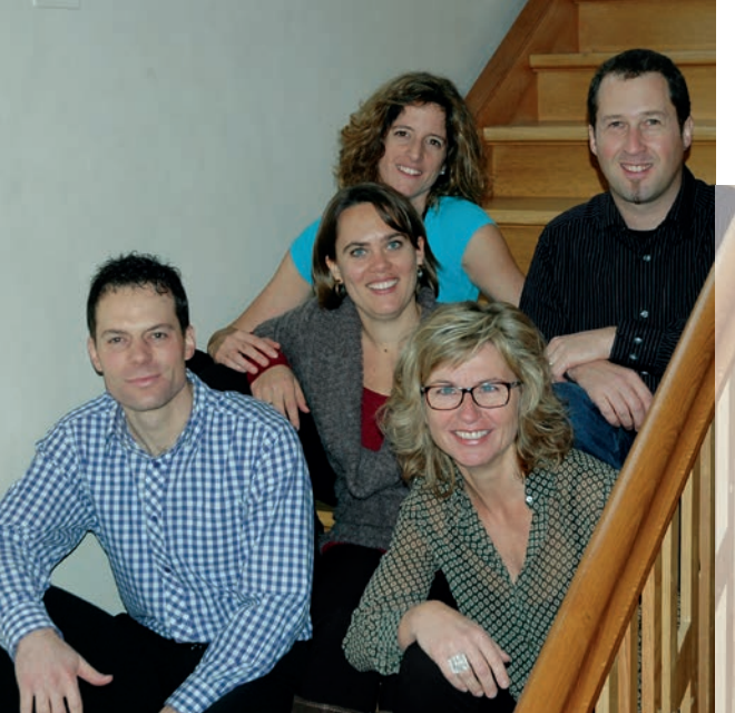
Das SOP-Team im 2012.