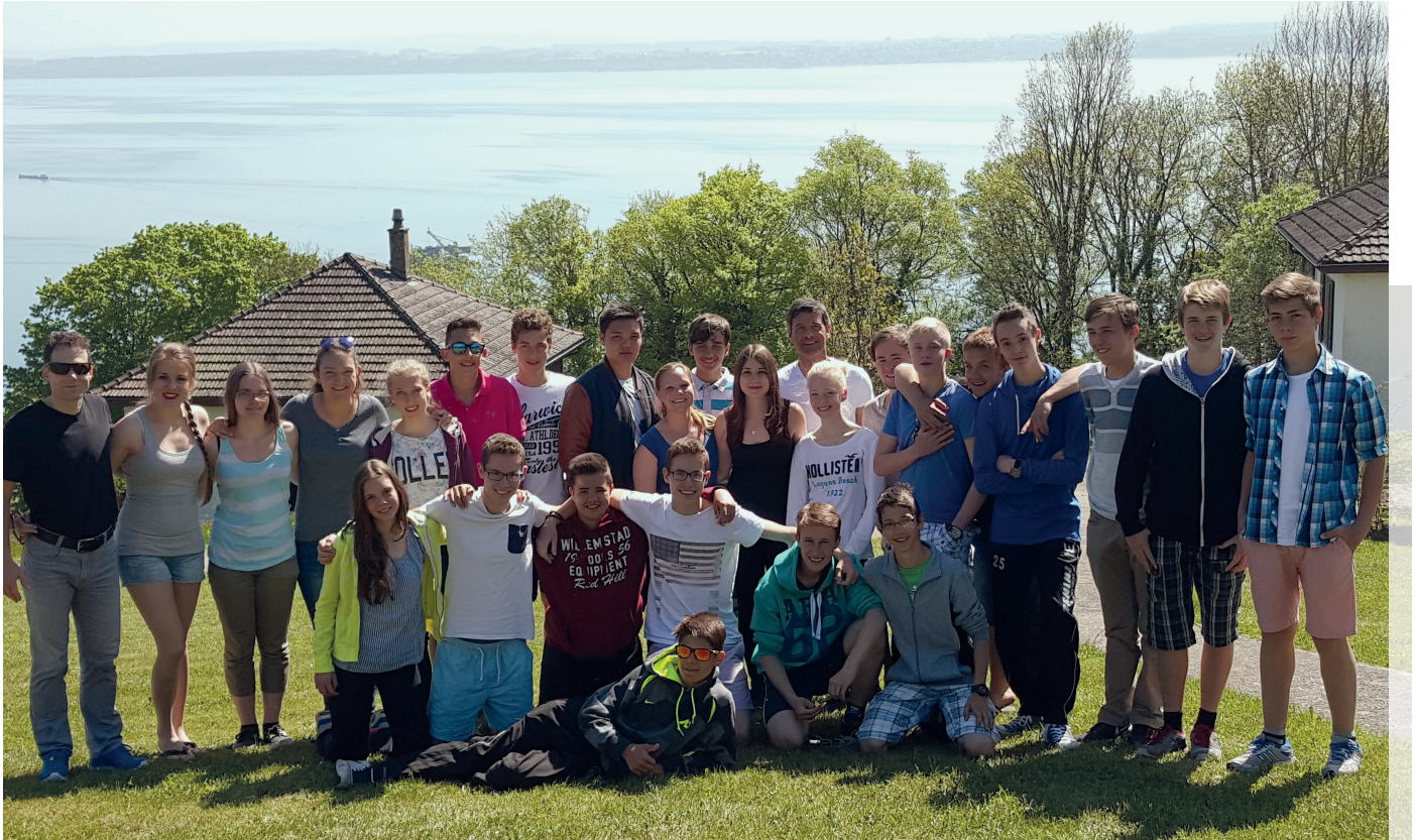
Die Konfirmanden von Johannes Huber genossen eine tolle und erlebnisreiche Woche am Neuenburgersee