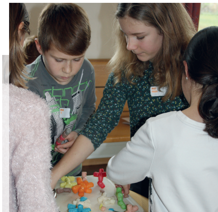
5.-Klässler am Werk.