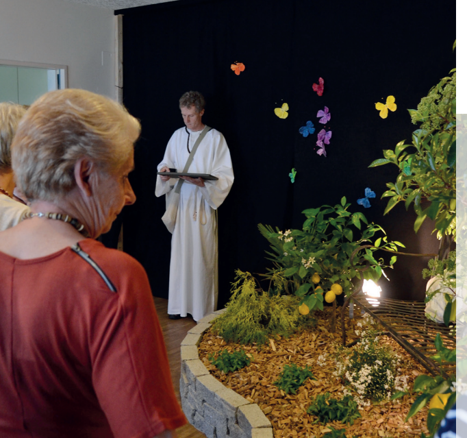
15 Reiseleiter/innen führten während zwei Wochen täglich rund zehn Gruppen durch den Ostergarten.