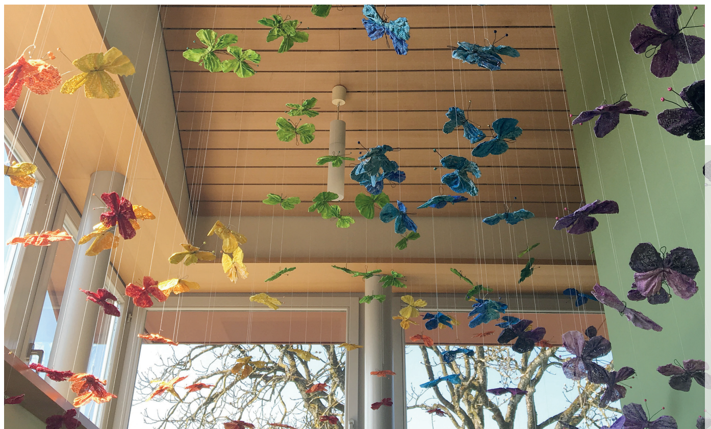
Der Ostergarten hat Herzen berührt und überraschte durch seine Vielfalt und Liebe zum Detail.