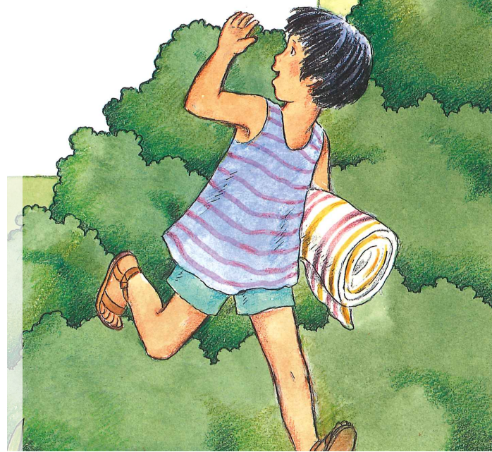
Herzliche Einladung an alle Kinder vom Kindergarten bis zur 5. Klasse zu den Kinderwochentagen vom 16. bis 18. August 2017 – jetzt anmelden!