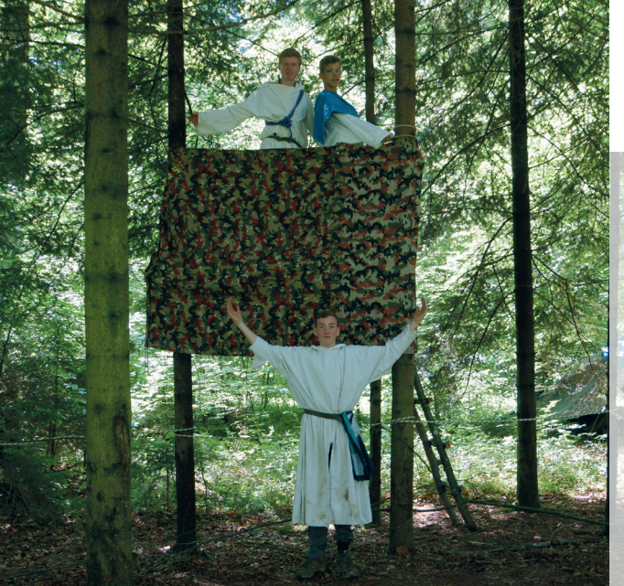
Pfila Stufe mjöhnr

Kinderaugen restlos erstaunen lässt. Am Samstag beginnt ihre Zeitreise in das antike Griechenland. Als Athleten bestreiten sie olympische Wettkämpfe und ringen, bauen, schwitzen, rätseln mit- und gegeneinander. Dabei schenken sie sich nichts, jeder will als bejubelter Held die Arena verlassen. Es begleitet sie die Geschichte zweier ruhmstüchtiger Athleten, die ihren Ehrgeiz zu zügeln lernen. Am Montag schliesslich nehmen die Eltern ihre ruchlos schmutzigen, aber ein Abenteuer reicheren Kinder in Empfang.