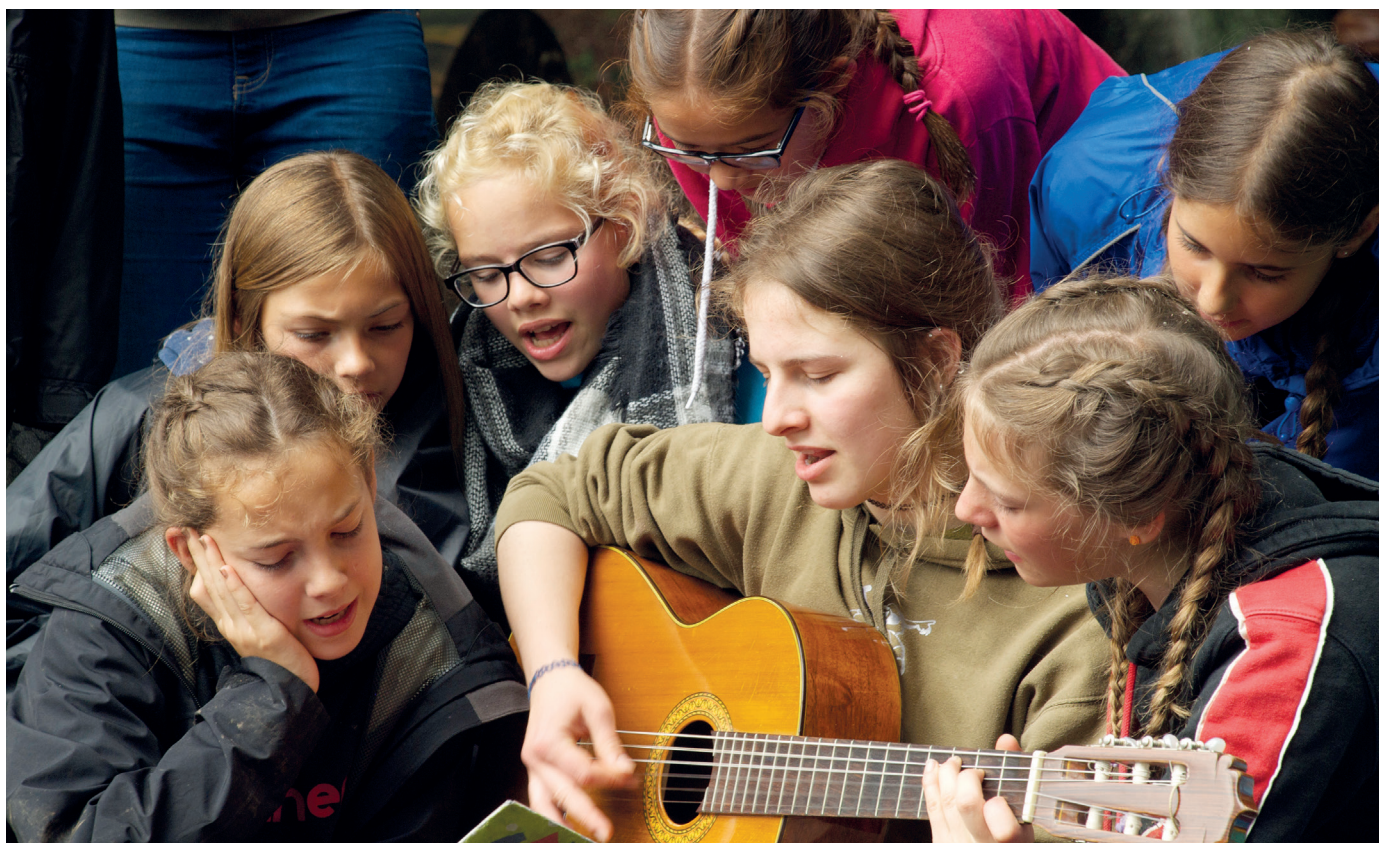
Pfila 2017