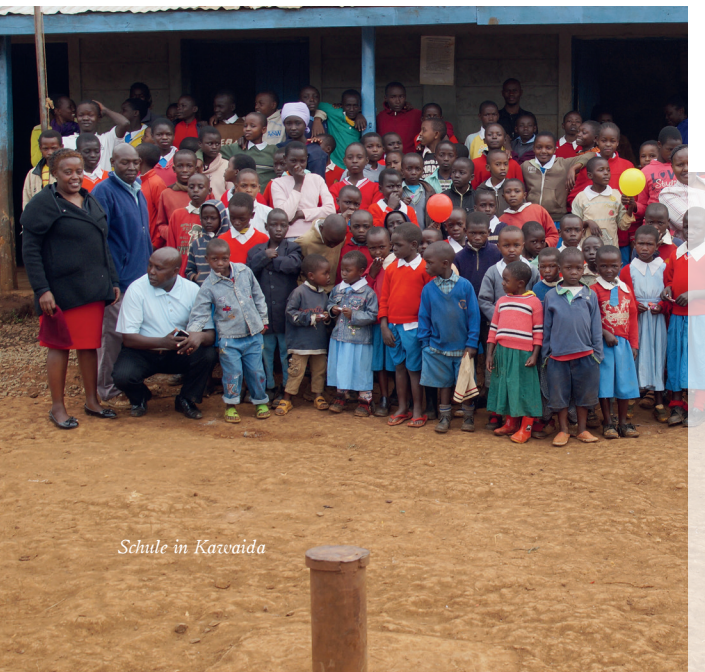
Schule in Kawaida

Am 30. Sept. findet als Höhepunkt und Abschluss der Spendenaktion der Kawaida Day im ref. Kirchgemeindehaus statt