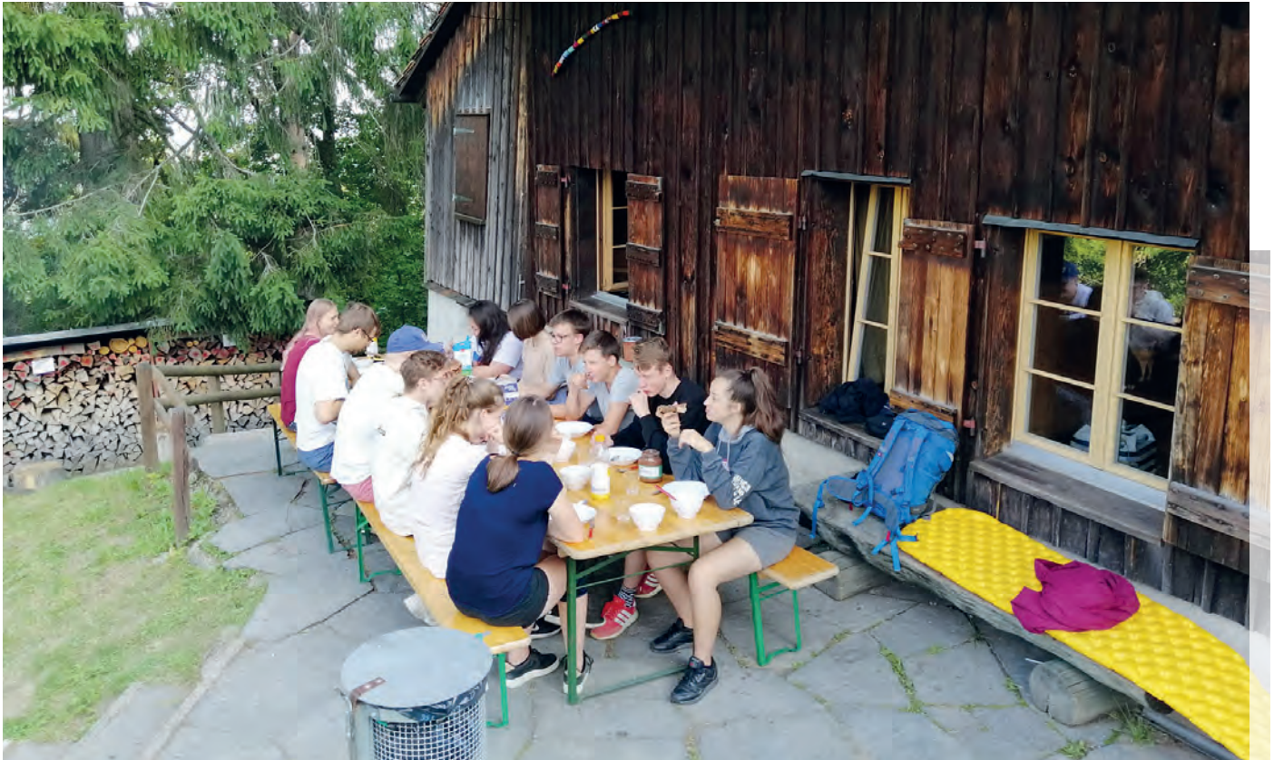
Rund 20 Ex-Könfler setzen ihre Reise gemeinsam fort und treffen sich regelmässig, hier im Nachkonf-Wochenend.