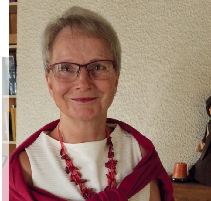
Die Andachten sind eine Herzensangelegenheit für Vreni Hartmann...