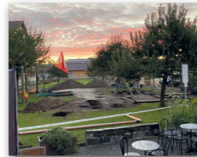
Baustelle Spielplatz beim Kirchgemeindehaus. Dieser wird praktisch komplett erneuert.