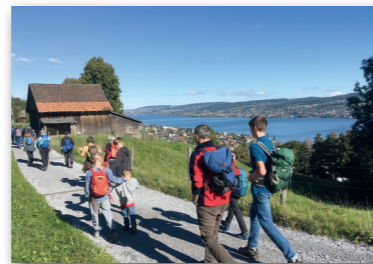
Die Herbstwoche im Allgäu (DE) muss leider coronabedingt abgesagt werden. Stattdessen findet eine HeWu at Home statt. Auch dieses Programm ist vielfältig.