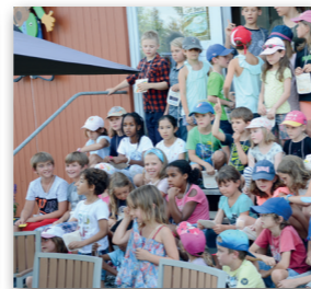
Die Kinderwoche kann stattfinden, zur grossen Freude der 60 Kinder.