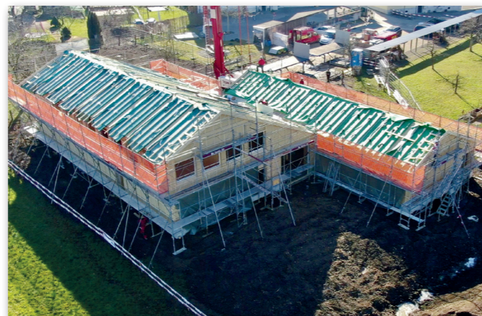
Am Cevihuus Vivo bauen neben Profis auch viele Freiwillige des Cevi und der Ref. Kirchgemeinde mit, darunter viele Handwerker. Im August 2020 steht das Haus, kann aber leider aufgrund der Corona-Situation noch nicht feierlich eingeweiht werden.