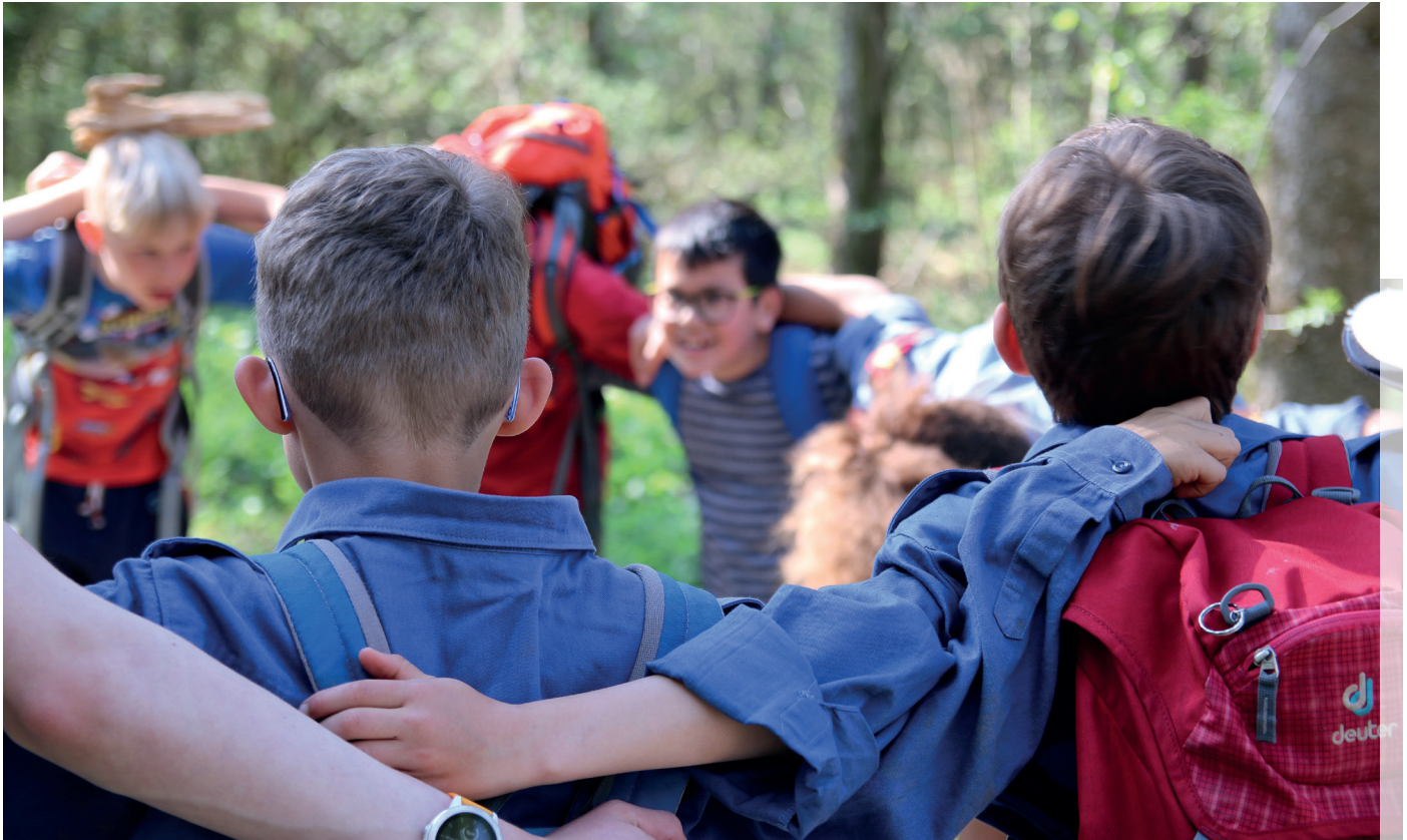
Viele haben in ihrer Zeit im Cevi langjährige Freundschaften geknüpft!