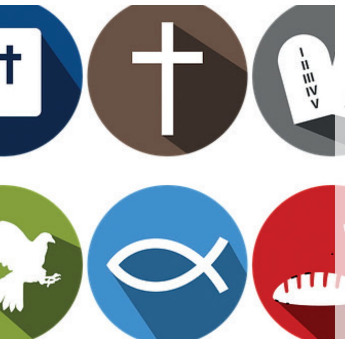
Jesus-Biografie in einem Jahr. (Illustration: zvg)

Die Vorgehensweise ist neu: Anhand des (Hör-) Buches «Jesus – Das Leben. Die authentische Biografie nach den Berichten der Bibel» von Karl-Heinz Vanheiden gehen wir chronologisch durch das ganze Leben Jesu. Einen besonderen Fokus legen wir dabei auf die jüdischen Hintergründe der Taten und Lehren von Jesus. Mit Hilfe von Leitfragen lesen wir jeweils zu Hause einen Abschnitt (ca. 20 Seiten) aus dem Buch. An den monatlichen Treffen wird das Gelesene durch