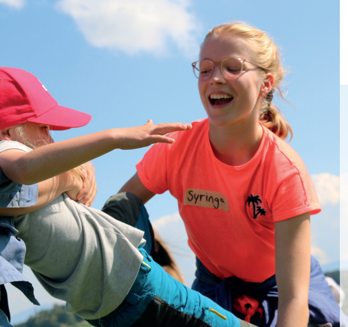
Ein Hoch auf deine Werbung für unseren Cevi!