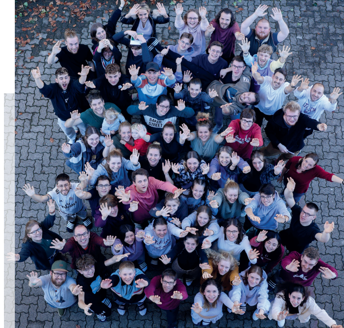
Neujahrslagerteilnehmer/innen 2021/2022