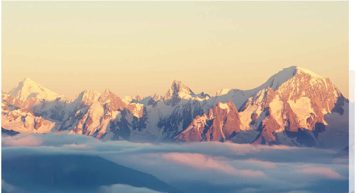
Zwei Referate und kreative Workshops inspirieren, sich am closer mit der Heiligkeit Gottes auseinander zu setzen.