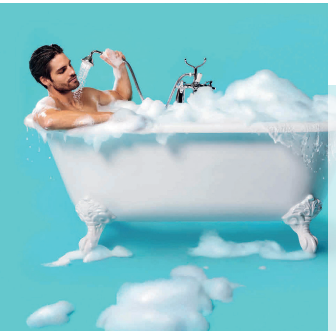
Verzichten? Ja gerne!