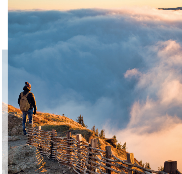
Männer-Events: Männer-Mountainbike-Tour am 10.9.2022, Männer-Wander-Weekend am 24./25.9.2022.