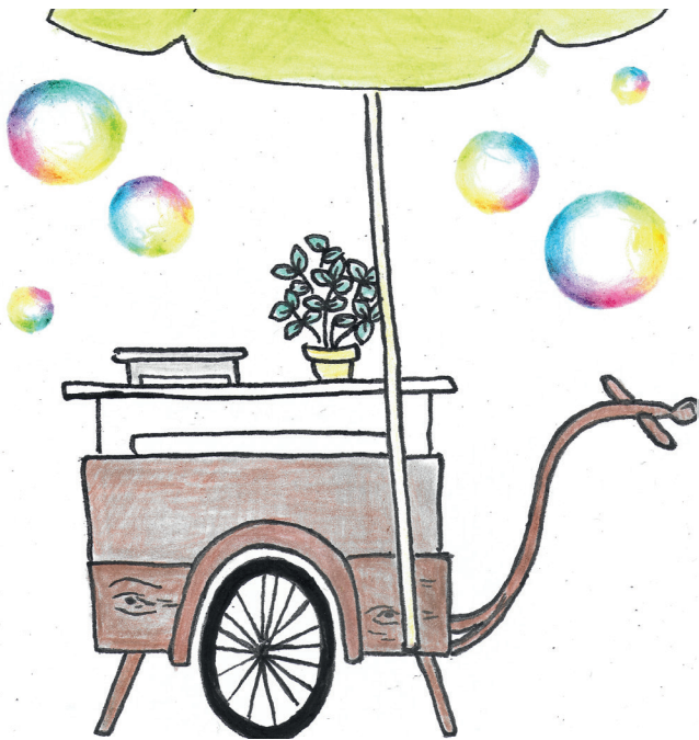
Crêplauder-Lisi (Zeichnung: Esther Nydegger)

Während das Crêpe brutzelt halten wir inne, lernen