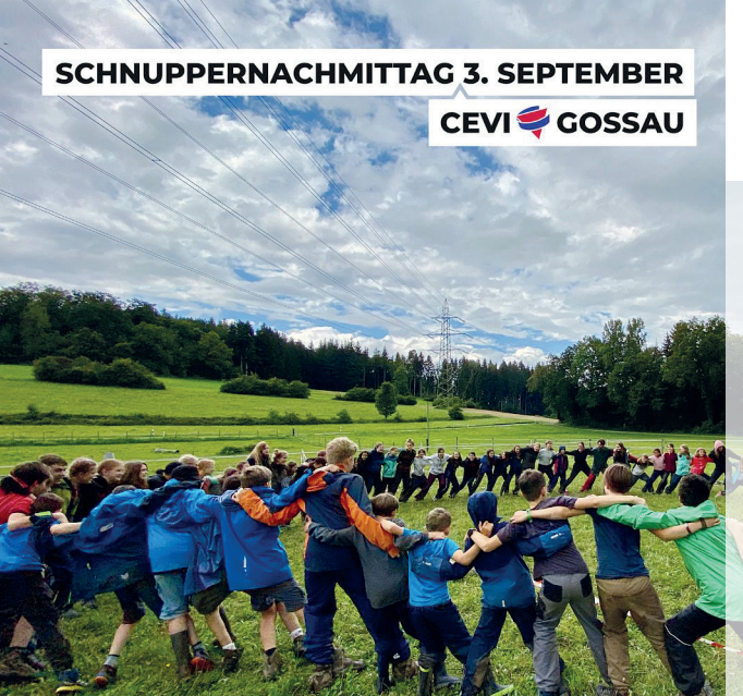
Herzlich willkommen zum Cevi-Schnuppernachmittag am 3. September 2022 um 13.30 Uhr beim Parkplatz Schlachthüsli Gossau.