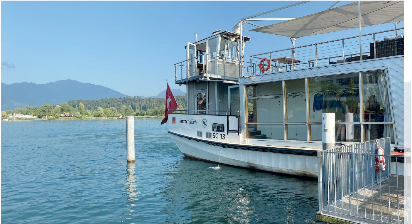
Das Mitarbeiterfest am 19. Juni 2022 auf dem schönen Zürichsee.