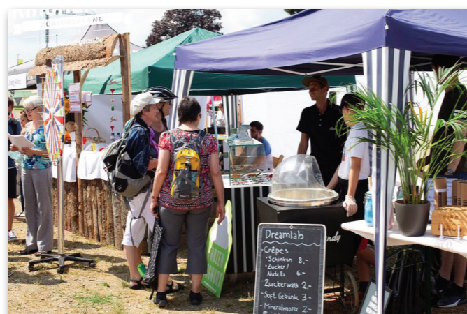
Kirchentag Züri Oberland, 5.–8. Juli 2018: Am Marktstand sind alle drei Gossauer Gemeinden vertreten – «mitenand glaube» ganz praktisch.