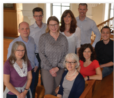
Gewählt für die neue Legislatur 2018–2022: Mitglieder der Kirchenpflege.