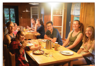
Nach der Konfirmation ist's nicht vorbei, dafür gibt es das Angebot «Nach-Konf».