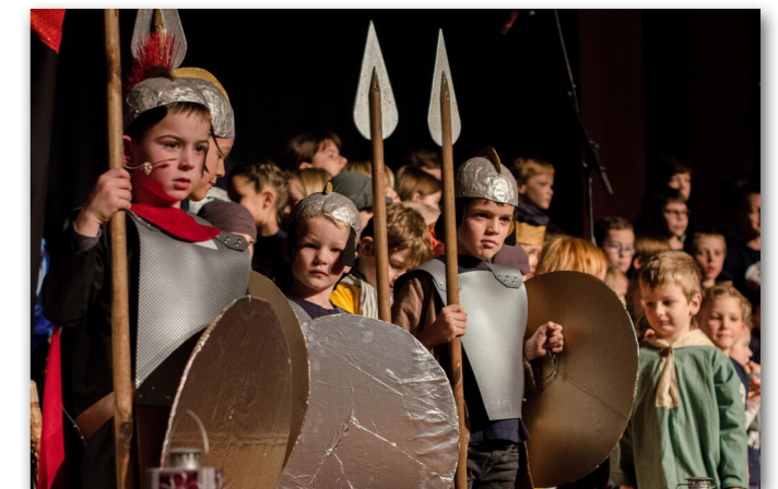
70 Kinder führen am 3. Advent in einer vollen Kirche das von Andrew Bond komponierte Weihnachtsmusical «Beni Ben Beiz» auf.

Die Kirchenpflege setzt sich intensiv mit dem KG+-Prozess im Bezirk Hinwil auseinander und ist an Konferenzen und Sitzungen überdurchschnittlich vertreten. Gossau gibt sich gegenüber einer Grossfusion im Bezirk Hinwil zurückhaltend und setzt seinen Schwerpunkt auf überregionale Zusammenarbeit und damit auf das Modell A (Dachverband/Kirchenbund).