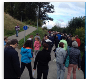
Am Bettags-Gottesdienst unterwegs im Dorf zusammen mit der katholischen Pfarrei und der Evangelischen Freikirche Chrischona Gossau.