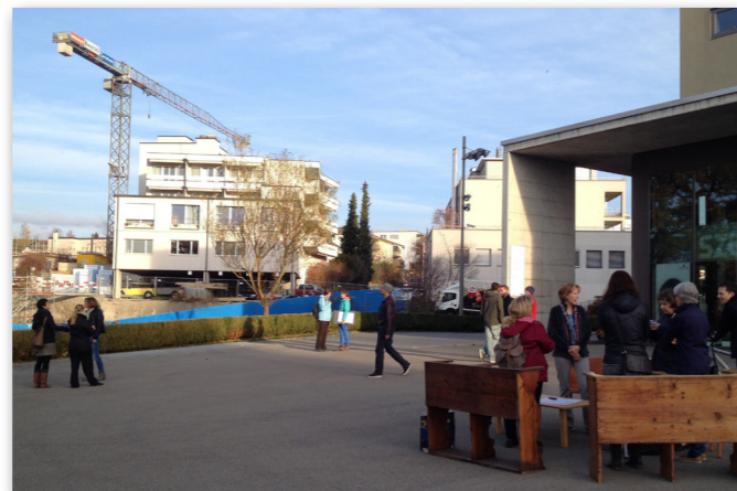
Der Impulstag vom 14. November stand unter dem Jahresmotto «Mit unserem Handeln bringen wir ein Stück Himmel nach Gossau». Vor dem Coop werden Passanten gefragt, ob und wo Sie Himmel erleben.