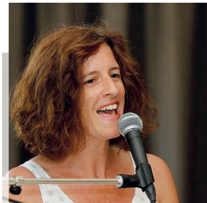
Eine Stunde mit Baba...