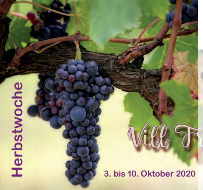
Herbstwoche vom 3. bis 10. Oktober 2020 - im Feriendorf Eglofs, welches in die liebliche Landschaft des Allgäus eingebettet ist.