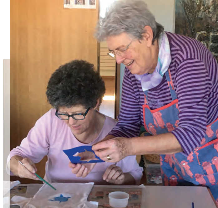
Body bedrucken