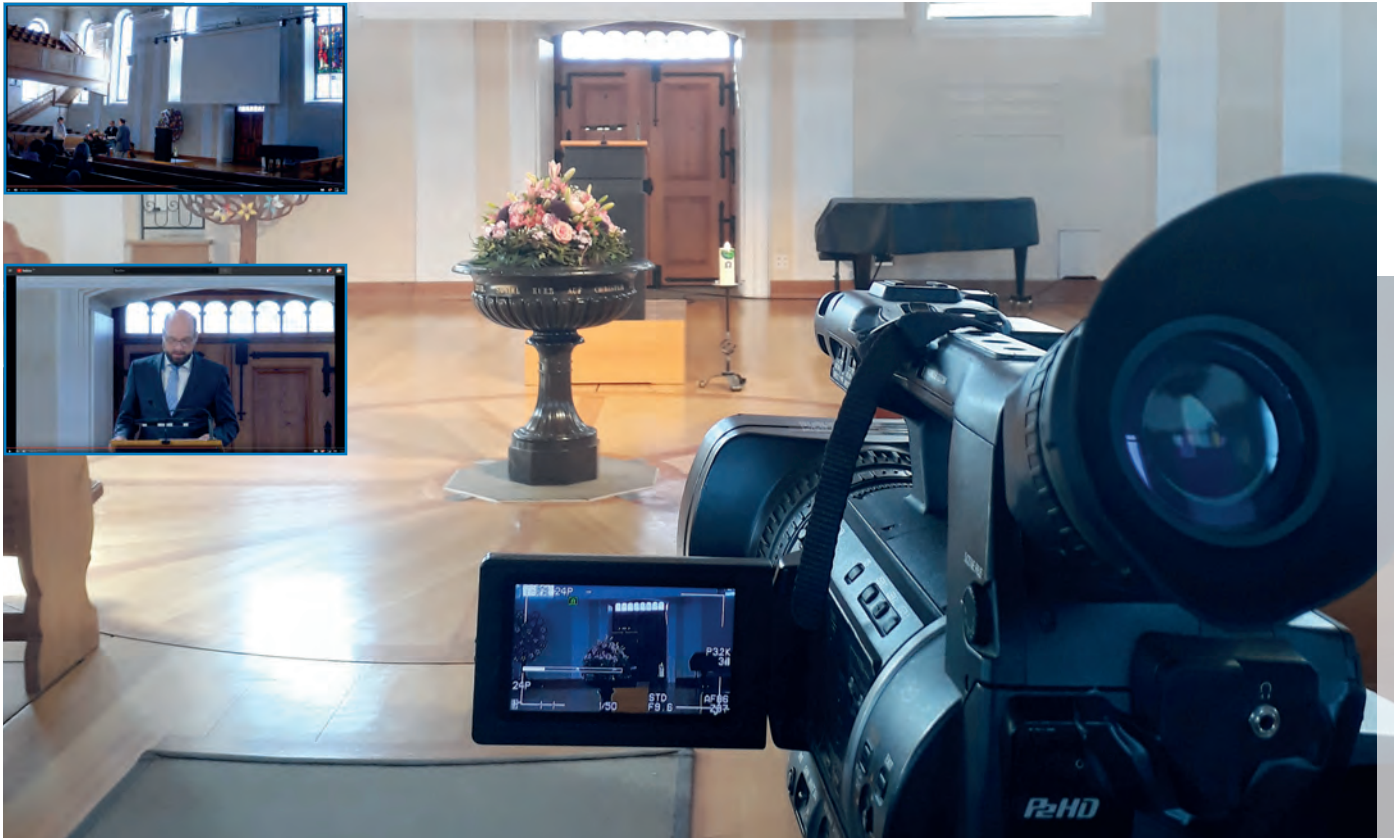
Bereits der Gottesdienst vom 15. März 2020 wurde aufgrund der verordneten Versammlungseinschränkung live übertragen.