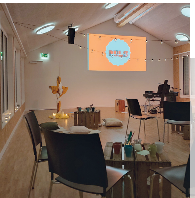
Im SaP startete die neue Input-Serie Passion of Christ. Im Puls vertiefen sich ältere Jugendliche in der aktuellen Themenreihe: Jesus lifestyle

Der SaP startete im Januar die neue Input-Serie «PASSION of CHRIST». Die Jugendlichen sollen be-