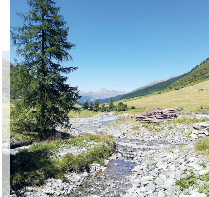
19. bis 24. Juni 2023: Seniorenferienwoche in Davos. Kommen Sie auch? Anmeldung bis 21. März 2023.