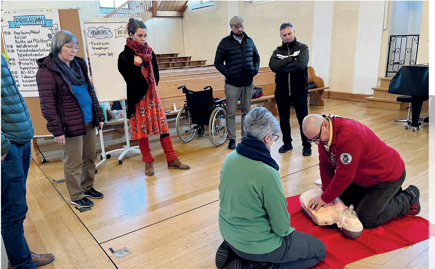
Alle haben ihre Rolle im Rahmen des Notfallkonzepts der reformierten Kirche Gossau kennengelernt.