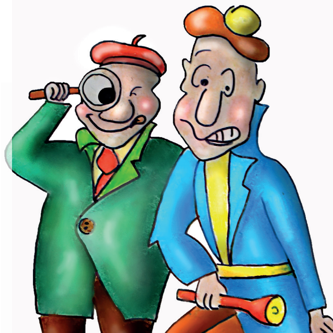
Kinderwoche 2023: jetzt anmelden.

Gemeinsam mit unseren KiWo-Detektiven begeben wir uns auf die Spur von grossen Wundern und vielen Überraschungen. Wir erleben ein kreatives und abwechslungsreiches Programm mit Geschichten aus dem Leben von Jesus, mit vielen Erlebnissen im Freien, Basteln, Singen & Spielen. Montag bis Freitag, von 14.00–17.00, und am Mittwoch treffen wir uns für