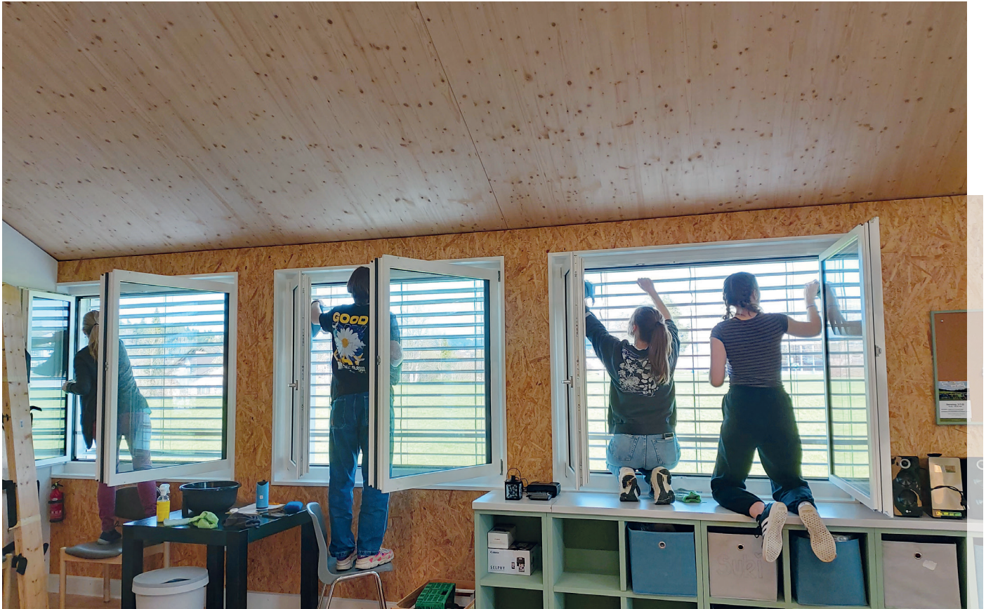
vivo Putzparty: 20 Cevianer/-innen aus allen Einsatzgebieten halfen mit.