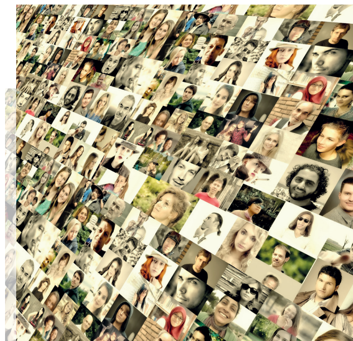
Bibel-iographie: Juda & ich