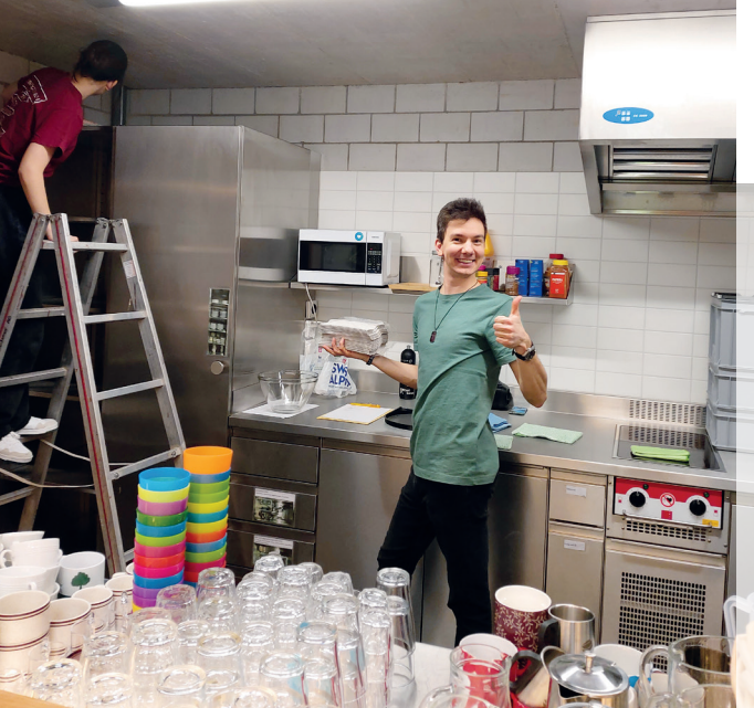
vivo Putzparty.