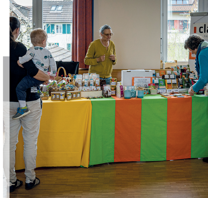
Am Nachmittag des 15. April 2023 fand das Local Aid Festival (LAI F) in Gossau statt.

dienste, Musik- und Chorprojekte, einen Marktplatz, Vorträge und Podiumsdiskussionen zu Theologie, Politik und Gesellschaft, sowie Gebetszeiten, einen Kunstweg, Spiel und Tanz, gutes Essen und viel Zeit für Austausch und Begegnung. Es ist ein überkonfessioneller Anlass, der von über 40 Kirchen und Freikirchen getragen wird und für jede Generation etwas bereithält. An verschiedenen Orten bilden sich Gruppen, die am Donnerstag, 6. Juli, nach Wetzikon zur Eröffnung pilgern. Diesen Gruppen darf man sich gerne anschliessen.