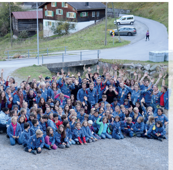
Wir freuen uns auf dich!