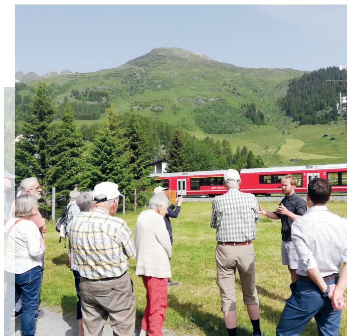
Seniorenferienwoche im Juni 2023 in Davos.