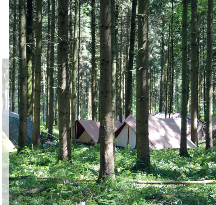
Cevi Gossau

Zu unseren Hauptaufgaben gehören das Bedienen an der Theke, das Verkaufen von Essen und Getränken und das Gespräche mit Besucher/innen führen. Jeden Freitagabend trifft sich das Pöstli-Team um 18.00 Uhr zum Abendessen. Danach wird besprochen, was an diesem Abend angeboten wird.