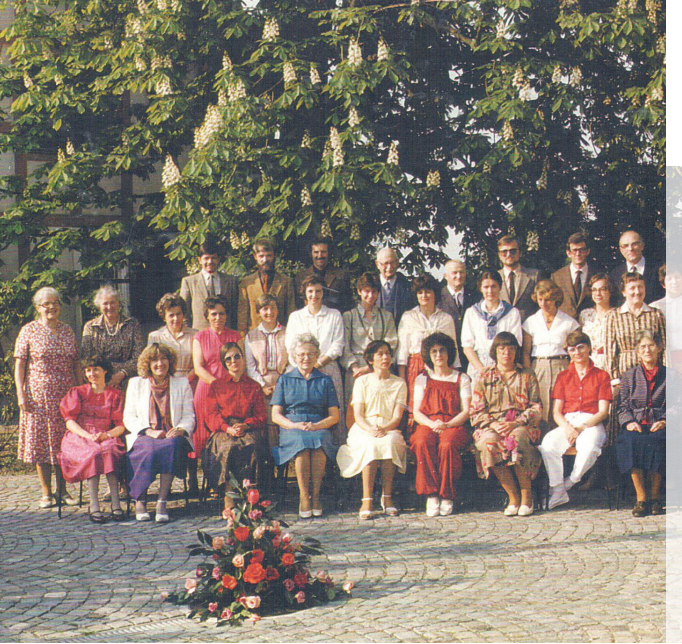
1982 Singkreis in den Anfängen: Der Singkreis jubiliert am 24. September 2023 um 10 Uhr.

Diesen werden wir als Singkreis festlich umrahmen mit der «Toggenburger Messe» von Peter Roth. Wir laden die Gemeindeglieder herzlich ein, am Jubiläums-Gottesdienst teilzunehmen.